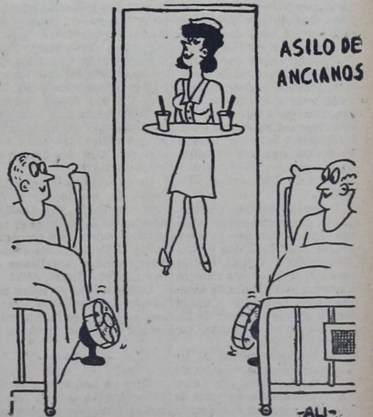
—¿Listo?... Apenas entre, aprietas el botón...