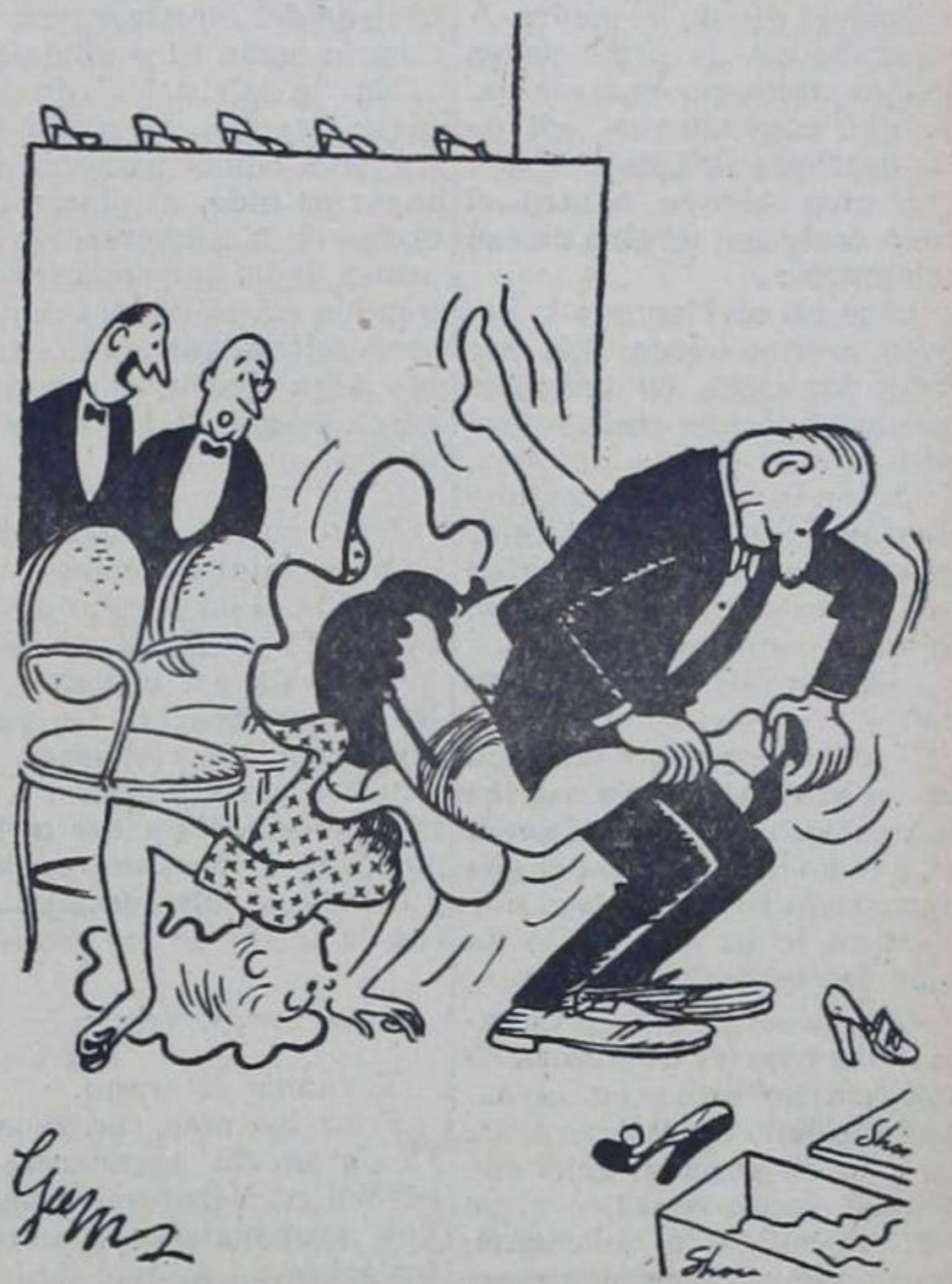
—Como antes trabajó en una herrería, tiene experiencia para tratar a las ... tercas.